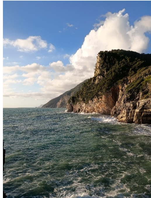
Abbildung 3. Sonnenuntergang bei Portovenere und Cinqueterre