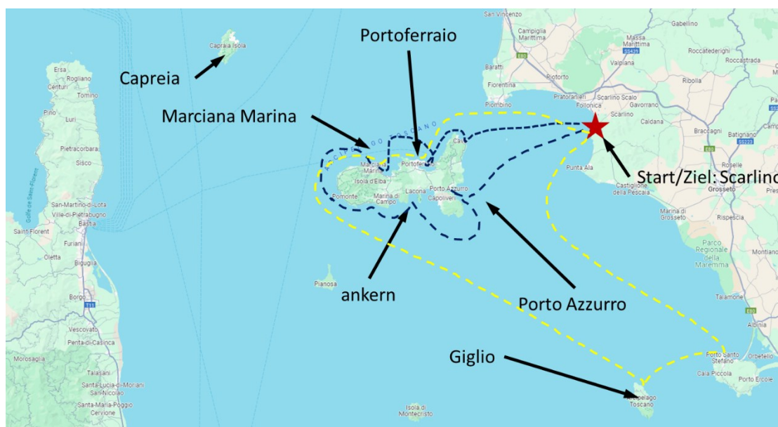
Abbildung 1. Seegebiet Ligurisches Meer um Elba mit geplanter Strecke (schwarze gestrichelte Linie).

Die Anmeldung (mit Warteliste) erfolgt über die Homepage des HSCF.