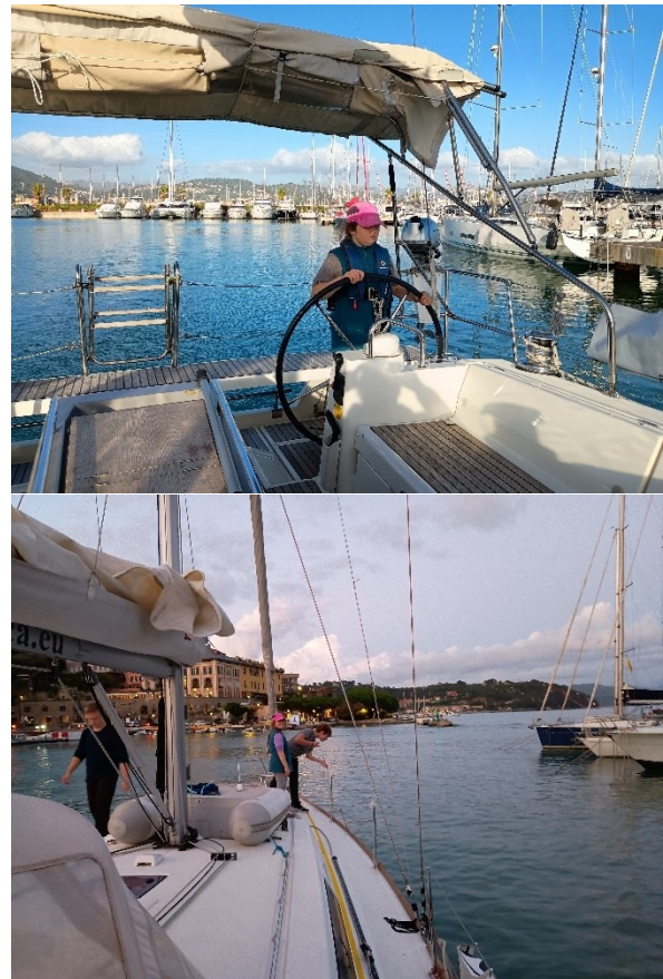
Abbildung 2. Impressionen Herbsttörn 2025. Optisegelerin am Steuer und die Abteilung „Jugend forscht“ beim Ermitteln der Wassertiefe

Ob an-/oder ablegen, einfach segeln und ankern oder Landgänge und Eis essen, wir werden kurze Strecken segeln (kein „Meilenfressertörn“) und den Anker auch mal nach nur sehr kurzen Schlägen fallen lassen. Im Vordergrund steht das gemeinsame Yachtsegeln mit den Jüngsten und deren Bedürfnisse. Was steigert auch die Begeisterung fürs Segeln und die Teamfähigkeit mehr, wenn tatkräftig mitgeholfen werden kann wo es möglich ist